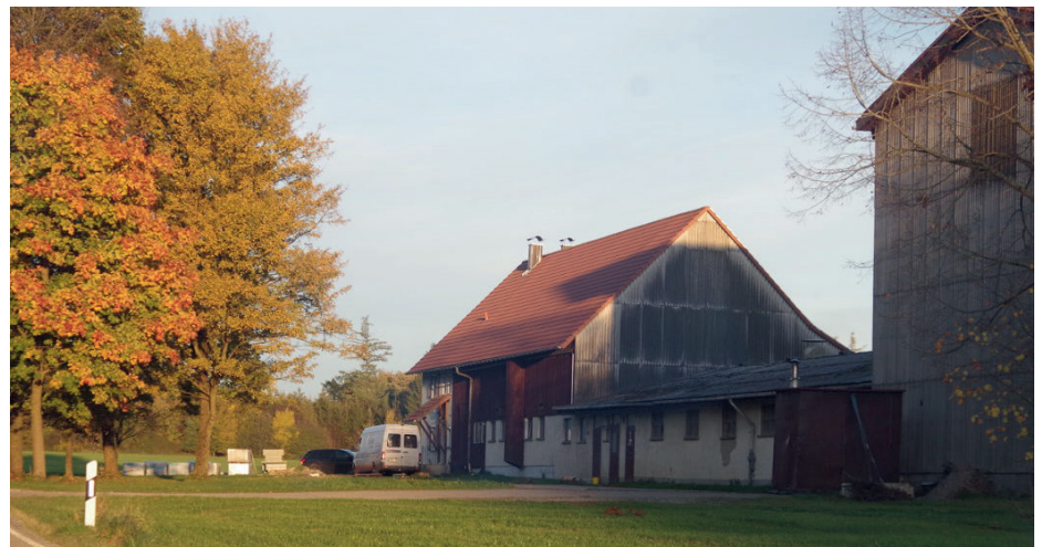
Abbildung 23: Nachdem das erste ANGRY, LIVE & LOUD -Konzert auf einem abgelegenen Gehöft in Bad Wurzach-Seibranz stattgefunden hatte...