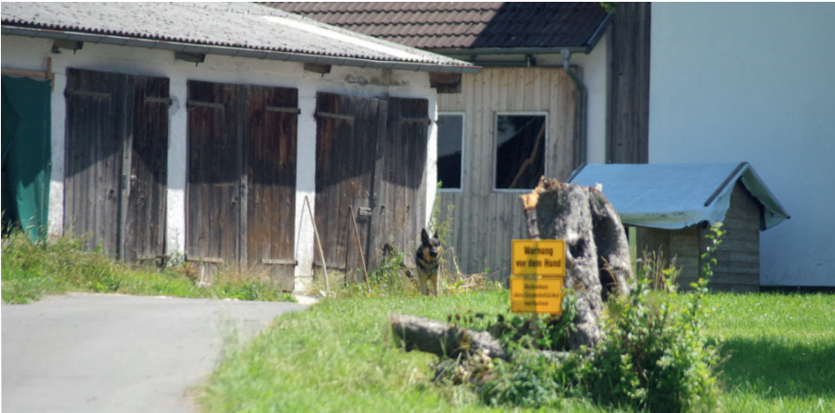
Abbildung 24: ... fand das zweite auf einem landwirtschaftlichen Anwesen in Aichstetten-Stockbauren statt.

Einige Monate später, am 14. Juli 2018, fand wenige Kilometer vom Gehöft in Bad Wurzach-Seibranz eine Neuauflage des ANGRY, LIVE & LOUD -Konzerts mit Kommando Skin sowie Kotten, Mistreat und Proissische Herzbuben statt. Nachdem die Verwaltungsgemeinschaft Memmingerberg das Konzert per Sicherheitsverfügung verboten und sich die Polizei bereits mit Hundertschaften aufgestellt hatte, um die Verfügung durchzusetzen, verlegte Voice of Anger die Veranstaltung kurzerhand in das benachbarte Bundesland (vgl. Lipp, 17.07.2018). Daher wichen die 170 angereisten Neonazis in das nahegelegene Aichstetten-Stockbauren (Landkreis Ravensburg) aus (siehe Abbildung 24). Die Verlegung des Konzerts, so erklärte eine Polizeisprecherin, habe sich für die Polizei erst im Laufe des Einsatzes herausgestellt. Sie richtete einen Kontrollpunkt am Bahnhof Aichstetten ein, um die eintreffenden Neonazis zu kontrollieren. Der Journalist Norbert Kelpp, der die Anreise der Neonazis vor Ort beobachtete, stellte PKW-Kennzeichen aus dem gesamten Bundesgebiet fest. Am Ende konnte das Konzert in Baden-Württemberg stattfinden.