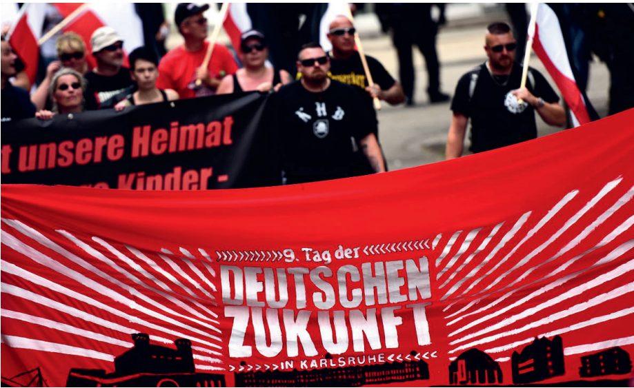
Abbildung 17: Im Vorfeld des Tages der deutschen Zukunft in Karlsruhe (03.06.2017) fand zur Mobilisierung ein Rechtsrock-Konzert statt.