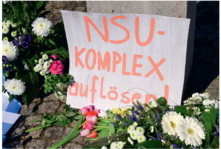
Abbildung 4: „NSU-Komplex auflösen!“ – Bis heute ist unklar, welche konkrete Rolle die Rechtsrock-Band Noie Werte im NSU-Komplex gespielt hat.

Im Münchener NSU-Prozess wurde Beate Zschäpe zu einer lebenslangen Freiheitsstrafe verurteilt, die vier NSU-Unterstüt-