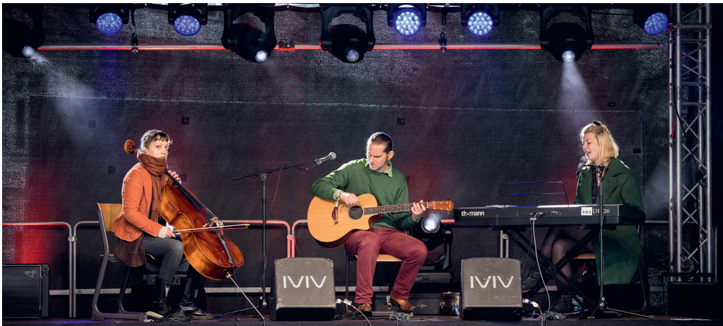
Abbildung 21: Die Band "Hauptsache dabei & Unerhoert" tritt beim 7. Ostritzer Friedensfest auf.

Erfahrung, wurde das von Schulen und Lehrer:innen einfach nicht wahrgenommen oder eine Auseinandersetzung mit den geschilderten Vorfällen gemieden.