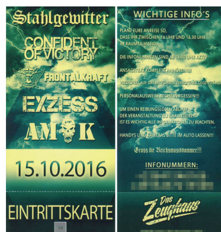
Abbildung 25: Eintrittskarte des konspirativen Rechtsrock-Konzerts in Unterwasser (St. Gallen/Schweiz) vom 15. Oktober 2016. Das Line-Up wurde kurzfristig um den Neonazi-Rapper MaKss Damage erweitert.

Denn die Arbeit der Sicherheitsbehörden ist Ländersache, weshalb der Grenzübertritt einen Zuständigkeitswechsel zur Folge hat. Die Problemwahrnehmung und die rechtlichen Rahmenbedingungen ändern sich. Zwar kooperieren die Sicherheitsbehörden der einzelnen Bundesländer miteinander, aber die Kommunikation braucht wertvolle Zeit. Die kurzfristige Konzertverlegung von Bayern nach Baden-Württemberg sollte, so die Hoffnung des Veranstalters, ausreichen, um das Konzert ohne Verbot durchführen zu können. In diesem Fall konnten die Behörden die Verlegung des Konzerts nicht verhindern.