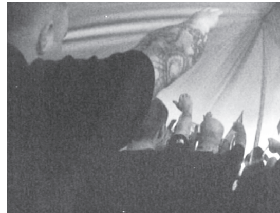
Abbildung 13: Üblicherweise werden im Rahmen von Rechtsrock-Konzerten unzählige Straftaten begangen, z.B. der Verkauf illegaler Materialien oder das Zeigen des verbotenen Hitlergrüßes.

Kuban: Das ist zunächst einmal wie bei Rockkonzerten auch. Da wird gefeiert, gesungen, getobt. Mit dem Unterschied, dass bei den Neonazis eine besondere Gruppendynamik entsteht. Kameradschaft