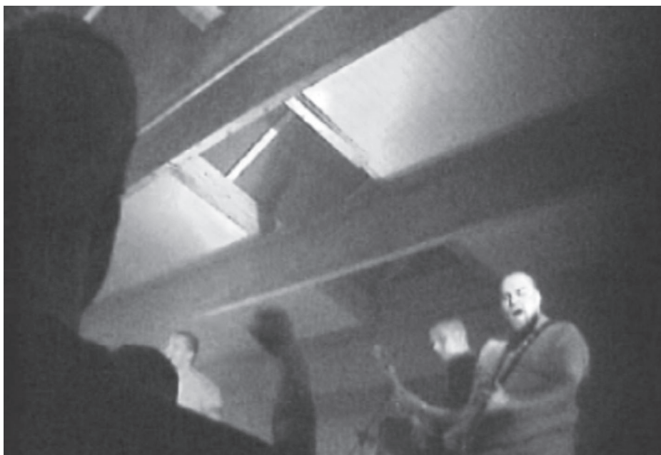
Abbildung 12: Eines der ersten Rechtsrock-Konzerte, das der Undercover-Journalist Thomas Kuban filmte und über das im Fernsehen berichtet wurde, fand im französischen Elsass statt.

Durch seine Rechercharbeit hat der Undercover-Journalist eine einmalige Innenperspektive der Rechtsrock-Szene erlangt. Kuban weiß, wie die Neonazis kommunizieren und sich organisieren, wie Konzerte beworben und durchgeführt werden, wie die Atmosphäre während eines Konzerts ist. Er war europaweit unterwegs – und begegnete immer wieder Rechtsrock-Bands aus Baden-Würt-