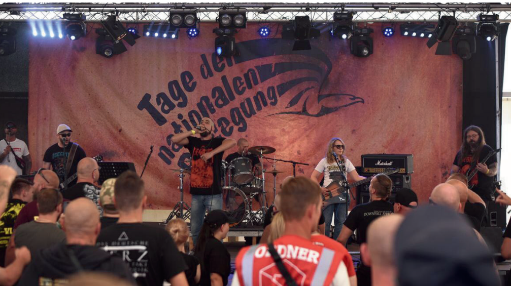
Abbildung 11: Am 06. Juli 2019 spielte Germanium im Rahmen der Tage der nationalen Bewegung vor 900 Neonazis in Themar (Thüringen).

Die Hälfte der Musikveranstaltungen in Thüringen, an denen sich Rechtsrock-Bands und Liedermacher aus Baden-Württemberg sowie Rechtsrock-Gemeinschaftsprojekte mit Musikern aus Baden-Württemberg beteiligt haben, fanden im Erfurter Kreuz in Kirchheim statt. Der Weiler gehört zur Gemeinde Amt Wachsenburg und liegt im Ilm-Kreis. Das Veranstaltungszentrum Erfurter Kreuz wird von der Neonazi-Szene seit 2009 für extrem rechte Veranstaltungen genutzt. So spielte Kommando 192 zwischen 2014 und 2017 mindestens fünf Mal und Kommando Skin zwischen 2015 und 2019 mindestens fünf Mal in der Lokalität. Am 15. Dezember 2015 spielten neben Kodex Frei und Tättervolk alleine fünf Rechtsrock-Bands mit baden-württembergischer Beteiligung ( Barbarossa , Carpe Diem , Devil's Project , Killuminati , Kommando Skin ).