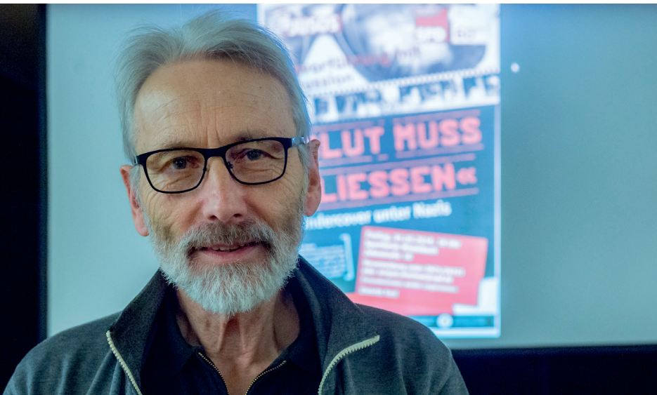
Abbildung 20: Der politische Filmmacher Peter Ohlendorf

Der politische Filmmacher Peter Ohlendorf hat 2012 den investigativen Dokumentarfilm Blut muss fließen – Undercover unter Nazis über sein Label FilmFaktum veröffentlicht. Der Film, der auf den heimlich gedrehten Aufnahmen des Undercover-Journalisten Thomas Kuban basiert und Rechtsrock-Konzerte dokumentiert (siehe Kapitel 5), feierte im Rahmen der Berlinale 2012 seine Premiere. Seitdem tourt Ohlendorf mit dem Film durch die Republik. Inzwischen hat er ihn über 2.000 Mal gezeigt und kam mit weit über 100.000 Menschen ins Gespräch – auch über ihre persönlichen Erfahrungen und ihren Umgang mit extrem rechter Musik.