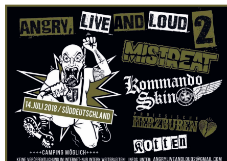
Abbildung 22: Die extrem rechte Skinhead-Kameradschaft Voice of Anger veranstaltete 2017/18 die zweiteilige und konspirativ organisierte Konzertreihe ANGRY, LIVE & LOUD .