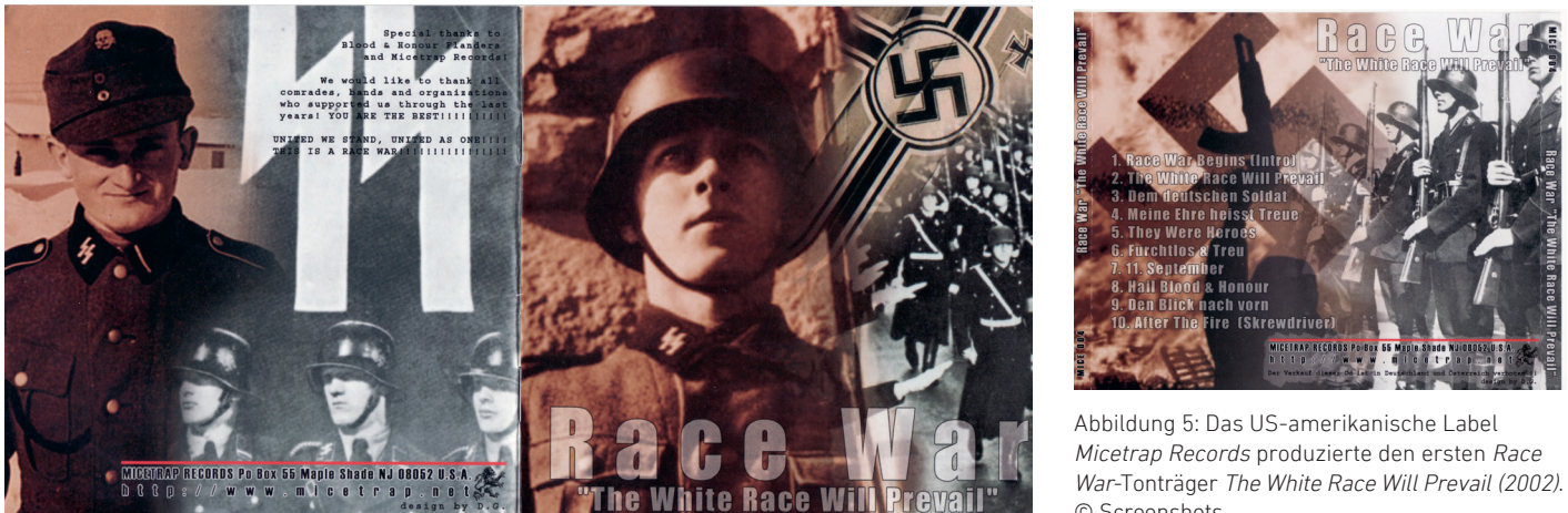
Abbildung 5: Das US-amerikanische Label Micetrap Records produzierte den ersten Race War-Tonträger The White Race Will Prevail (2002).

Band im Rahmen einer Veranstaltung der B&H-Sektion Flandern neben britischen und deutschen Rechtsrock-Bands vor ca. 1.800 Menschen nahe Antwerpen in Belgien (siehe Abbildung 6). Neben Konzerten in Deutschland und europäischen Nachbarstaaten ist ein Konzert in den USA bekannt: Vom 27. bis 30. Mai 2005 luden die Imperial Klans of America gemeinsam mit der US-amerikanischen B&H-Division zum 5. Nordic Fest . Für das Festival, das in Dawson Springs im Bundesstaat Kentucky stattfand, wurden