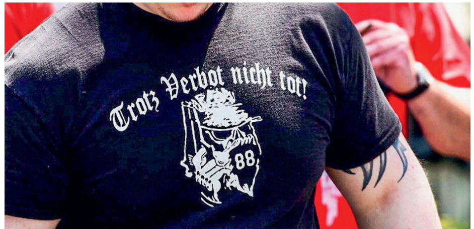
Abbildung 7: „Trotz Verbot nicht tot!“ – Obwohl die deutsche B&H-Division 2000 und die deutsche C18-Division 2020 verboten wurden, lebt das B&H/C18-Netzwerk in Deutschland fort. Das gilt nicht zuletzt für Baden-Württemberg.

Am 23. Januar 2020, etwa 20 Jahre nach dem Verbot der deutschen B&H-Division, wurde Combat 18 Deutschland durch das Bundesinnenministerium verboten. Das Verbot geschah im Kontext der Ermordung des Kasseler Regierungspräsidenten Walter Lübcke durch den Neonazi Stephan Ernst (02.06.2019). Ernst soll Kontakte zum C18-Umfeld gepflegt haben.