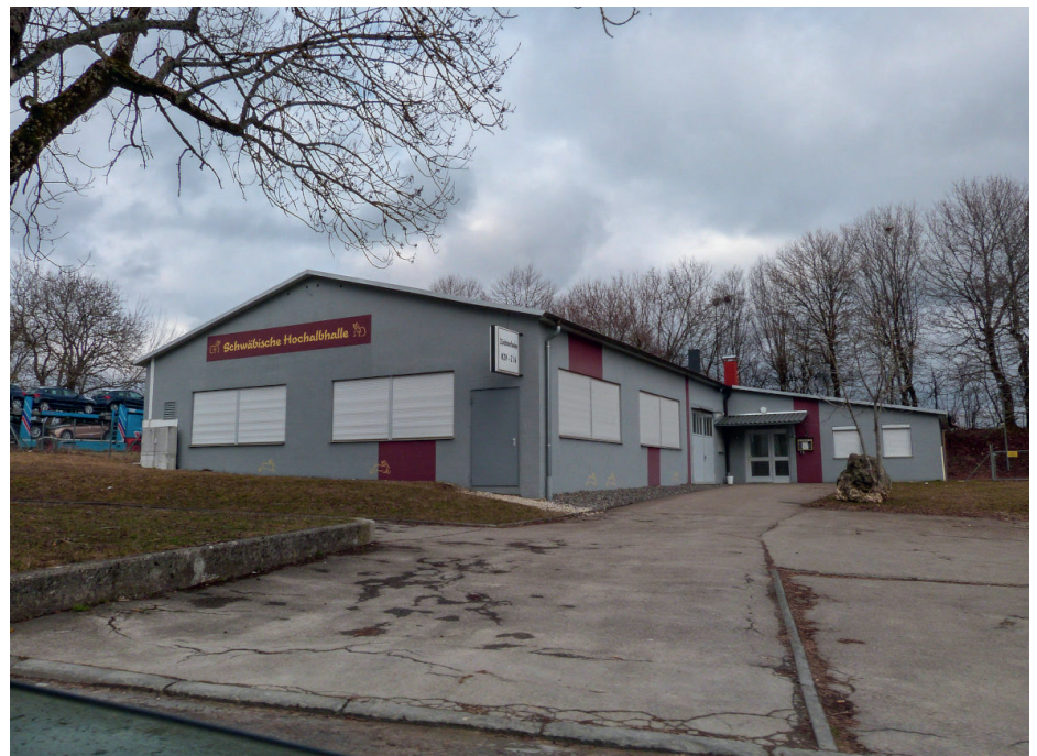
Abbildung 16: Am 02. März 2019 fand in der Schwäbischen Hochalbhalle des örtlichen Kaninchenzuchtvereins ein geheimes Konzert mit zwei Rechtsrock-Bands aus Baden-Württemberg statt: Germanium und Kommando 192 .

Nach dem Sicherheitscheck erhalten die Teilnehmenden weitere Informationen zum Veranstaltungsort. Später machte die Plattform den Konzertort publik: die Schwäbische Hochalbhalle (siehe Abbildung 16) des örtlichen Kaninchenzuchtvereins in Bitz (Zollernalbkreis), einer Kleinstadt mit 3.700 Einwohner:innen zwischen Albstadt und Burladingen. Am Abend hielten rund 30 Autos an der Halle, die meisten Kfz-Kennzeichen stammten aus der Region. Allgäu rechtsaußen berichtete, die Polizei sei vor Beginn des Konzerts abgezogen. Im Nachgang des Rechtsrock-Konzerts wurde bekannt, dass ein junger, recht unscheinbarer Mann die Halle für eine Geburtstagsfeier angemietet hatte. Der Vorsitzende des Kaninchenzuchtvereins äußerte gegenüber der Lokalpresse: „Wenn wir gewusst hätten, wer dahintersteckt, hätten wir das Vereinsheim natürlich nicht vermietet.“ (Eyrich, 06.03.2019)