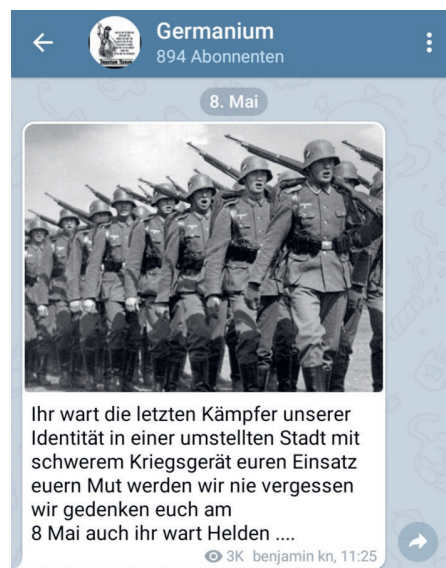
Abbildung 10: Rechtsrock-Bands wie Germanium nutzen die Sozialen Medien. In den Kanälen tritt die extrem rechte Ideologie zu Tage.

Über zwei Drittel der Musikveranstaltungen in Sachsen, an denen sich Rechtsrock-Bands und Liedermacher aus Baden-Württemberg sowie Rechtsrock-Gemeinschaftsprojekte mit Musiker aus Baden-Württemberg beteiligt haben, fanden im Alten Gasthof in Staupitz statt. Das 300-Seelen-Dorf gehört zur nord-sächsischen Stadt Torgau. Zwischen 2014 und 2018 spielte Kommando Skin mindestens fünf Mal in der Lokalität. Am 28. September 2019 feierte Noie Werte gemeinsam mit der sächsischen Rechtsrock-Band Neubeginn , Gesta Bellica (Italien) und Warlord (Großbritannien) ihr Comeback. Die Rechtsrock-Band hatte sich Ende 2010 aufgelöst (siehe Kapitel 8).