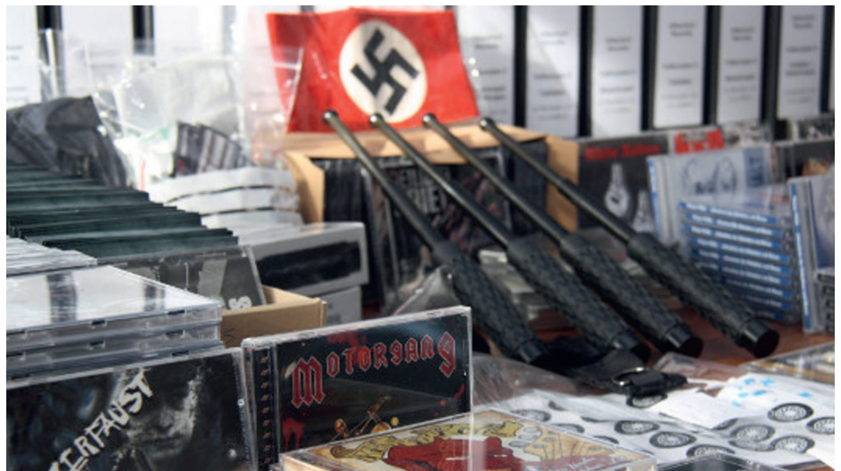
Abbildung 19: Die Kriminalpolizei Memmingen stellte 2014 im Zuge einer Razzia umfangreiches Material sicher.

und im Juli 2019 einen Telegram -Kanal erstellt. Auf der Website beklagte das Label eine angebliche Zensur: „Da Facebook ein Auslaufmodell für die sogenannte Meinungsfreiheit ist, versuchen wir euch auch hier auf dem Laufenden zu halten.“ (alle Fehler im Original; vgl. Oldschool Records 2021b) Der Telegram -Kanal hat über 1.100 Abonnent:innen (Stand: 06/2021). Er bewirbt im Wesentlichen neue Klamotten und Tonträger aus dem eigenen Sortiment. Beispielsweise wurde am 03. Februar 2021 die neue Vinyl-Platte WEHR DICH – FIGHT BACK von Heiliger Krieg beworben (siehe Abbildung 18).