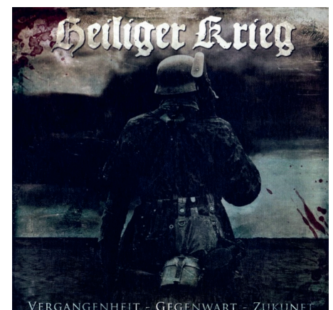
Abbildung 2: Die Tonträger der Rechtsrock-Band Heiliger Krieg verherrlichen Wehrmacht und Weltkrieg.