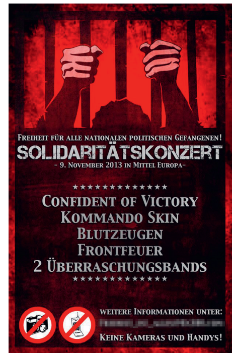
Abbildung 15: Am 09. November 2013 fand ein „Solidaritätskonzert“ für „alle nationalen politischen Gefangenen“ statt. Es spielten drei Rechtsrock-Bands aus Baden-Württemberg: Carpe-Diem , Heiliger Krieg und Kommando Skin .

Mit der Vermietung des Gasthauses Rössle zum Anfang des Jahres 2014 musste die Neonazi-Szene nach neuen Lokalitäten für große Rechtsrock-Konzerte suchen. Ende 2015, rund zwei Jahre später, wurde sie in Bad Wildbad-Calmbach (Landkreis Calw) in der Region Nordschwarzwald fündig. Calmbach, eine Kleinstadt mit ca. 5.000 Einwohner:innen, ist ca. 20 Kilometer von Pforzheim entfernt. Die Betreiberin